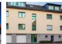
Gästehaus der Standesbeamten 2