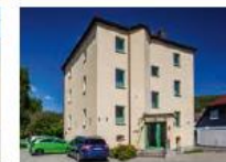
Gästehaus der Standesbeamten