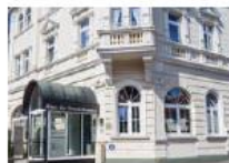
Haus der Standesbeamten